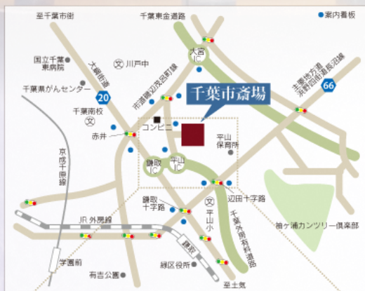
■千葉市斎場案内図■

千葉市斎場は、最新の火葬施設を備えています。 場内はバリアフリーになっており、人にやさしく環境に配慮した施設です。