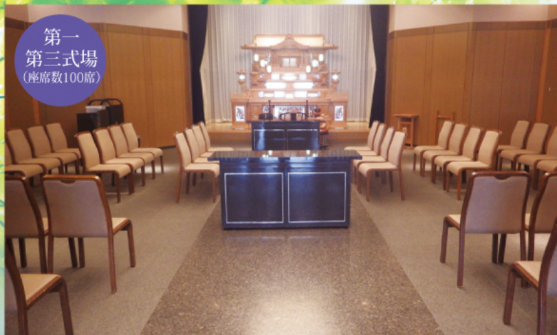
第一 第三式場 (座席数100席)