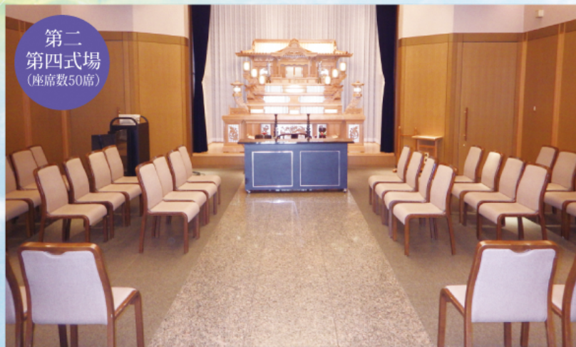
第二 第四式場 (座席数50席)