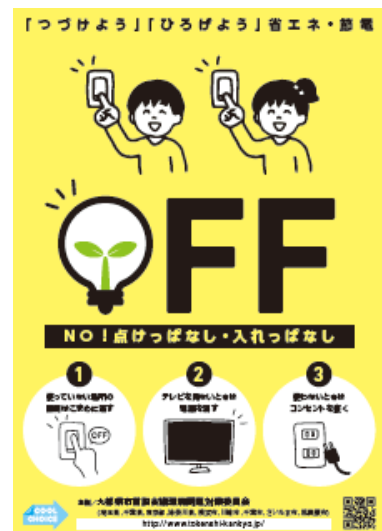
キャンペーンポスター

◇九都県市は地球温暖化対策に資する「賢い選択」を 促す国民運動「COOL CHOICE」に賛同しています。