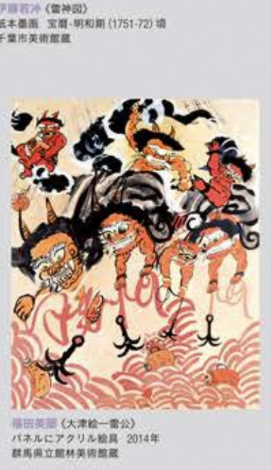
福田美蘭《大津絵一雷公》 パネルにアクリル絵具 2014年 群馬県立館林美術館蔵