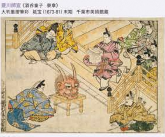
慶川積宣《酒吞童子 表章》 大判墨摺華彩 延宝(1673-81)末期 千葉市美術館蔵