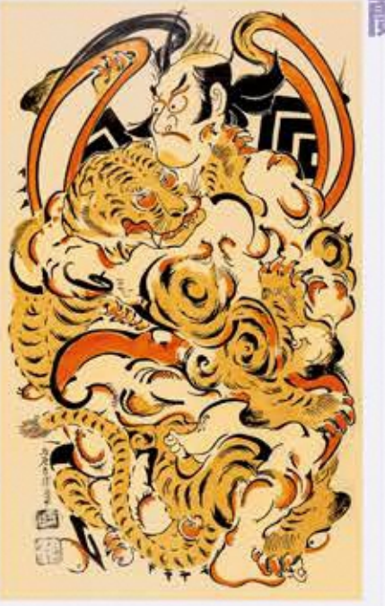
福田美蘭《二代目市川團十郎の虎退治》 パネルにアクリル絵具 2020年