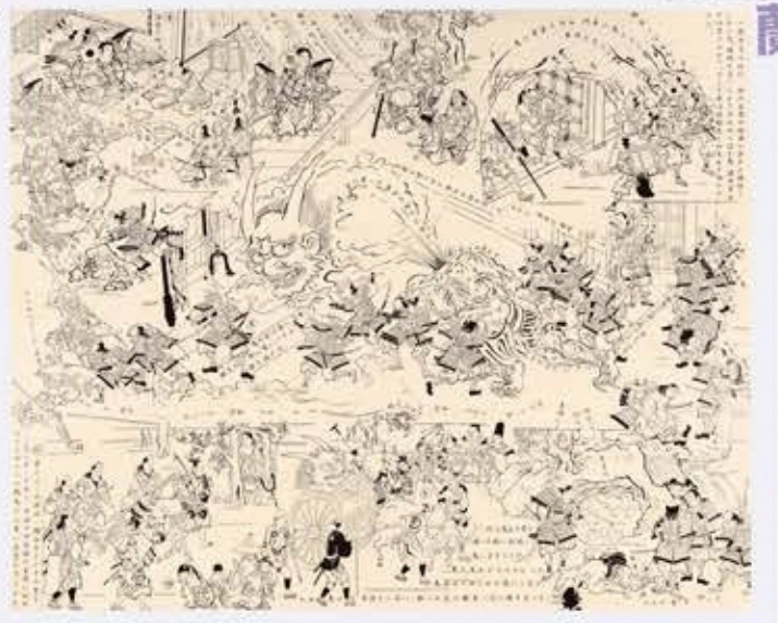
福田美蘭《大江山の酒吞童子退治》 パネルにアクリル絵具 2019年