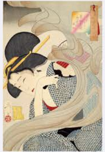
月岡芳年 《風俗三十二相 けむさう 享和年間内室之風俗》 大判錦絵 明治21年(1888) 千葉市美術館蔵

本展は、2001年の世田谷美術館、2013年の東京都美術館以来の大規模な個展となります。福田の飽くなき探究心をもって制作された作品を通して、コレクションの意義を見直すとともに、美術館という場における私たちの体験そのものを問い直す契機になればと願っています。