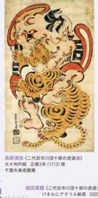
鳥居清徳《二代目市川團十郎の虎退治》 大々判丹絵 正徳3年(1713)頃 千葉市美術館蔵