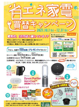
キャンペーンチラシ