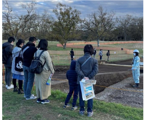
昨年度の現地説明会の様子