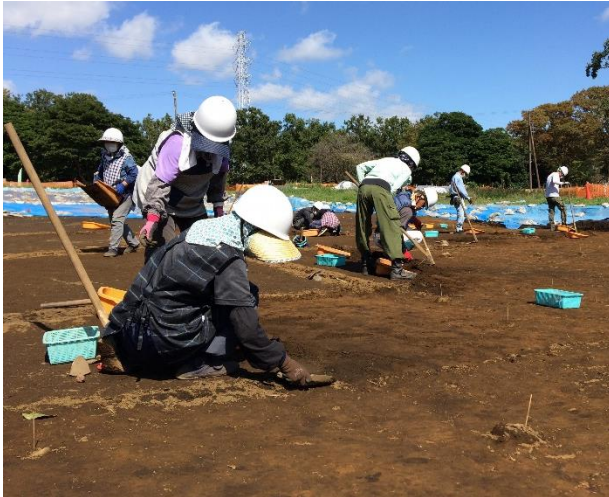
今年度の発掘調査の様子

南貝塚は中央窪地を取り囲むようにして馬蹄形に貝層が巡っているが、貝層の一部を調査したところ、直下に縄文時代後期（今から約4000年前）の竪穴住居跡が確認された。また、貝層中に焼けた土の層が2面確認され、そこが生活の場として利用されていたことがとらえられた。