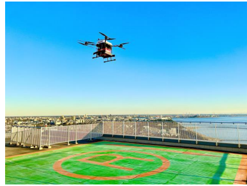
ドローンが到着する様子