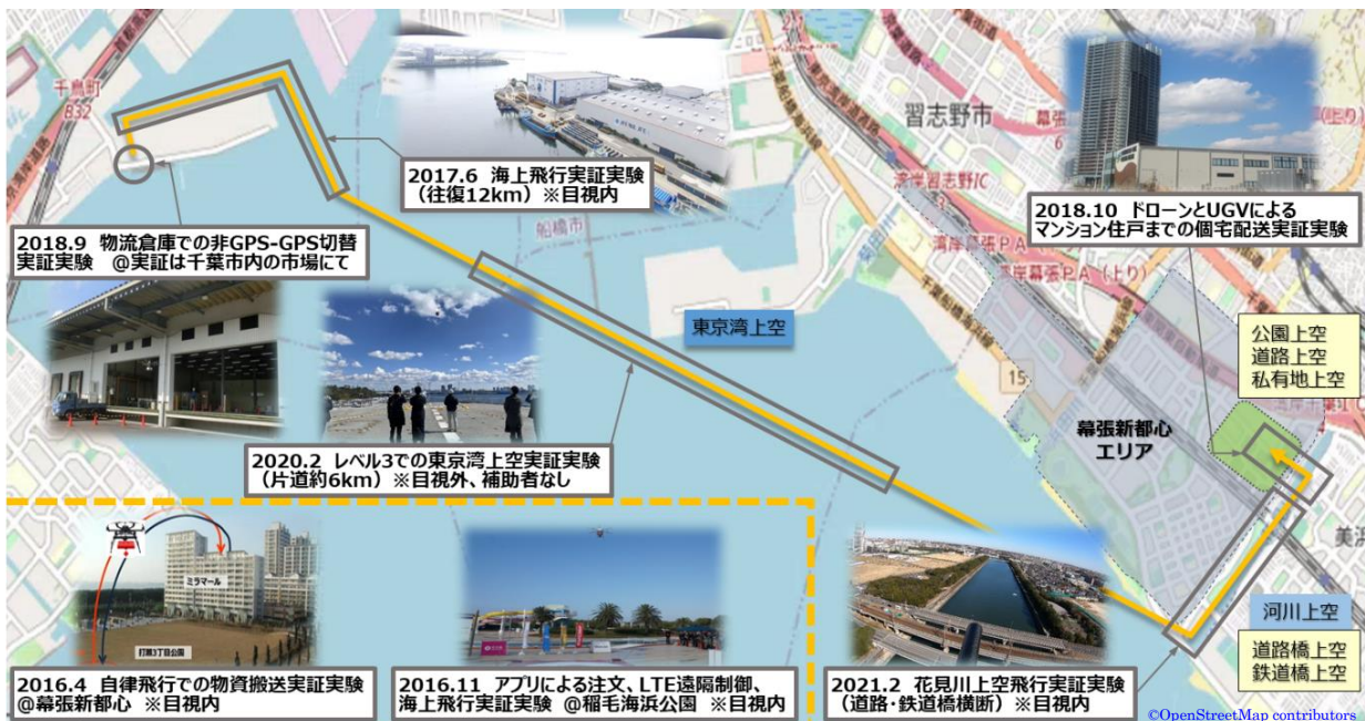
千葉市ドローン宅配構想のルート及びこれまでの実証実験概要