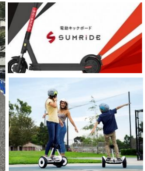
mini Segway の 試乗体験もあるよ!