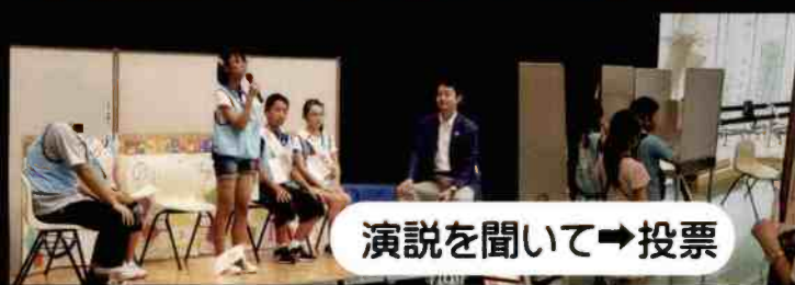
演説を聞いて → 投票