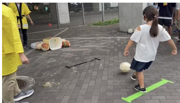
千葉商科大学スポーツ体験ブース （イメージ）