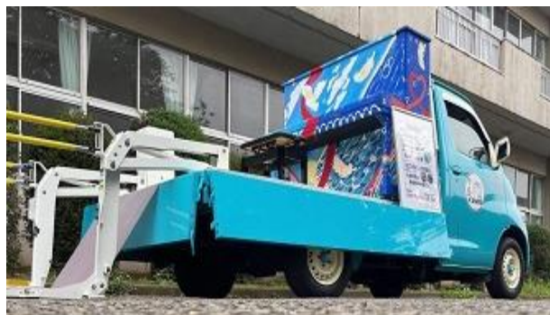
クルマ de ピアノ （イメージ）