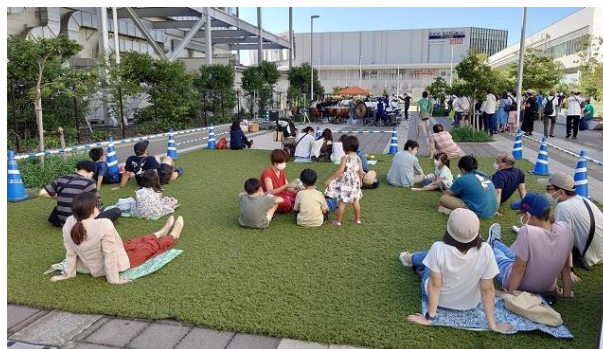
ZOZO マリン人工芝ゾーン （イメージ）