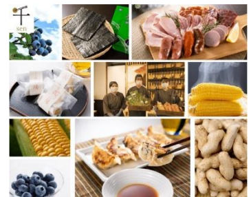
千葉市食のブランド「千」認定