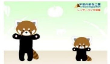
レッサーパンダ体操