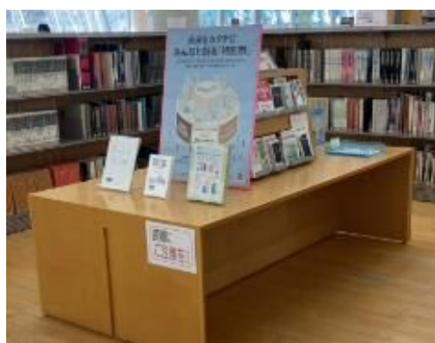
千葉市中央図書館内 大都市制度コーナー