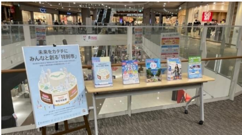
大規模商業施設における市民向け広報

⇒ 指定都市を応援する国会議員の会との連携、 地元選出国会議員への積極的な働きかけ、二重行政等の実態調査・整理