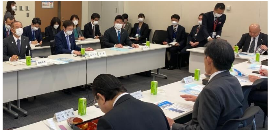
指定都市を応援する国会議員の会 役員勉強会