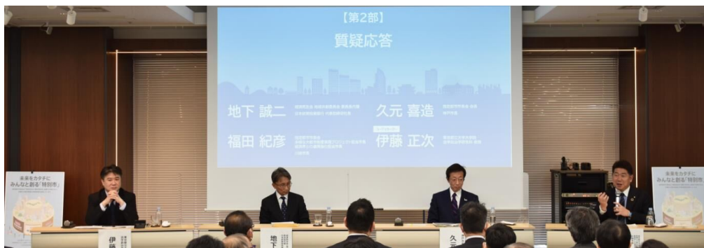
指定都市市長会シンポジウムin川崎