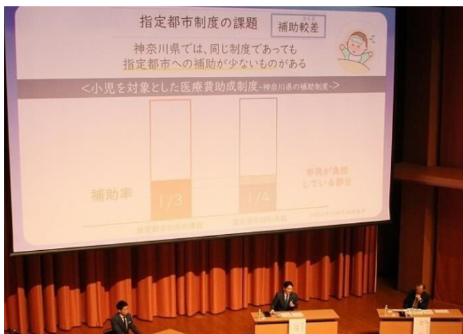
指定都市市長会シンポジウムin横浜