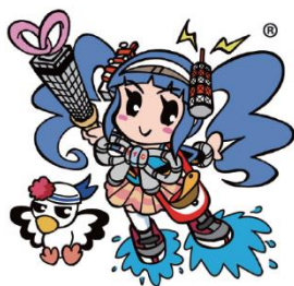
千葉みなとのご当地キャラ チバミナコちゃん