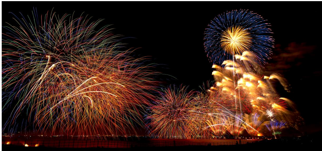
令和元年度開催の「幕張ビーチ花火フェスタ2019(第41回千葉市民花火大会)」