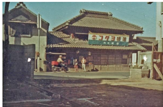
⑥写真「和田紙店」（昭和時代戦後）