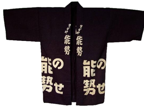
④法被（タダヤ能勢） （個人蔵）