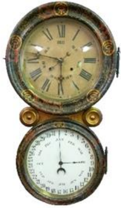
①奈良屋時計（明治20年代） （千葉県立中央博物館大根分館蔵）