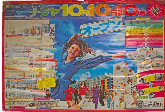
②広告チラシ（ニューナラヤオープン） （当館蔵）