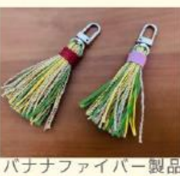
バナナファイバー製品