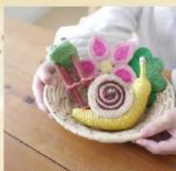
バングラデシュ小物