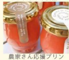
農家さん応援プリン