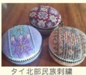
タイ北部民族刺繍