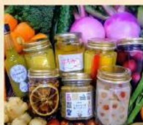
千葉県産野菜・加工品