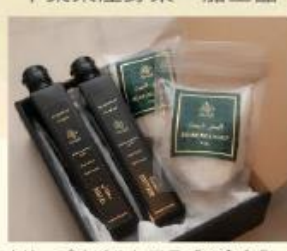
オリーブオイルとアラブの食文化