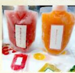
恋するスムージー