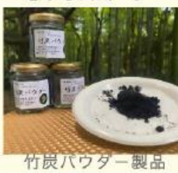
竹炭パウダー製品