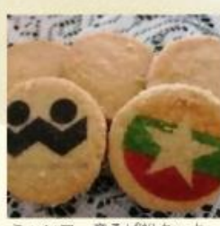
ミャンマー産そば粉クッキー