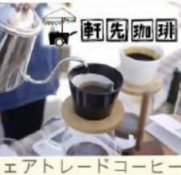
フェアトレードコーヒー