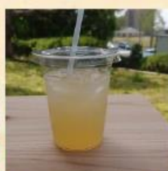
はちみつレモンジンジャーエール