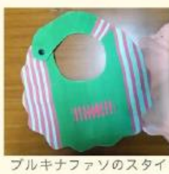
ブルキナファソのスタイ