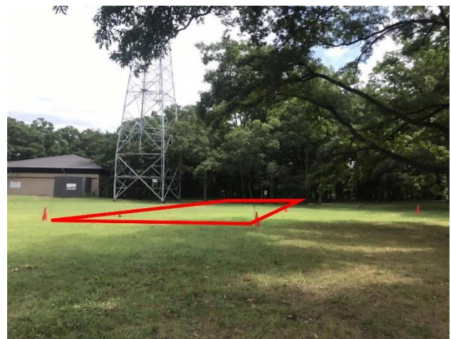
現地の様子 (左図の矢印方向から)