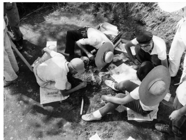
昭和37年の人骨調査風景 (2)