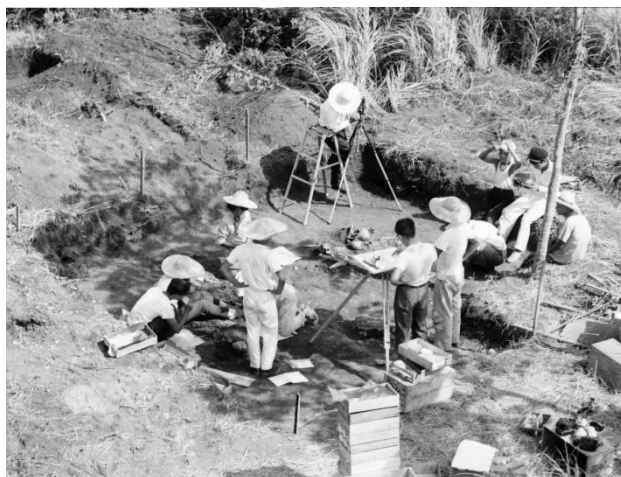
昭和37年の人骨調査風景 (1)