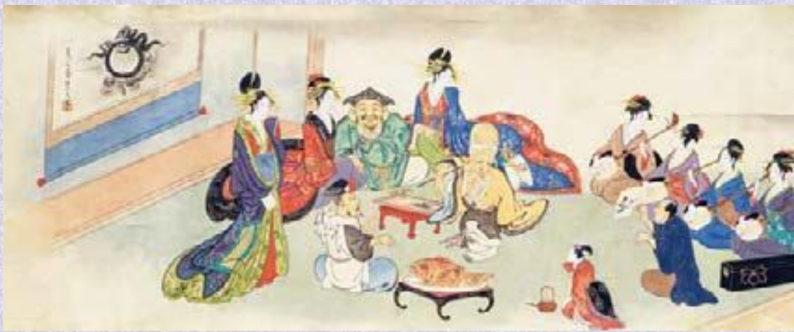
鳥文斎栄之(三福神吉原通い図巻)絹本着色1巻 文政(1818-30)前期頃 千葉市美術館蔵