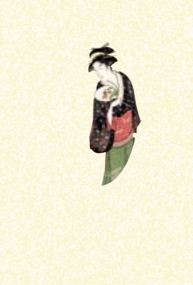
左：鳥文斎栄之《青楼美人六花仙 松葉や若菜》 大判錦絵 寛政6年(1794)頃 大英博物館蔵 The British Museum, 1945,1101,0,24 右：鳥文斎栄之《松竹梅三美人》 大判錦絵 寛政4-5年(1792-93)頃 ポストン美術館蔵 Museum of Fine Arts, Boston, William Sturgis Bigelow Collection 11.14079

鳥文斎栄之 (ちょうぶんさい・えいし 1756-1829)は、旗本出身という異色の出自をもち、美人画のみならず幅広い画題で人気を得た浮世絵師です。浮世絵の黄金期とも称される天明～寛政期(1781-1801)に、同時代の喜多川歌麿(?-1806)と拮抗して活躍しました。