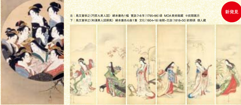
左：鳥文斎栄之《円窓九美人図》 絹本着色1幅 寛政7-8年(1795-96)頃 MOA美術館蔵 ※前期展示 下：鳥文斎栄之《和漢美人図屏風》 絹本着色6曲1隻 文化(1804-18)後期-文政(1818-30)前期頃 個人蔵

寛政10年(1798)頃より、栄之は錦絵出版から離れ、肉筆画に集中するようになります。武家出身の栄之は、当時厳しくなっていた幕府の出版統制に、歌麿のように抗う立場を取ることもできなかったでしょう。若年期より磨かれた確かな画技は、華やかな肉筆の美人画を次々と生み出していきます。寛政12年(1800)頃に後桜町上皇の御文庫に隅田川の図を描いた作品が納められたというエピソードも伝わっており、栄之の作品はとくに上流階級や知識人などから愛されたことがわかります。