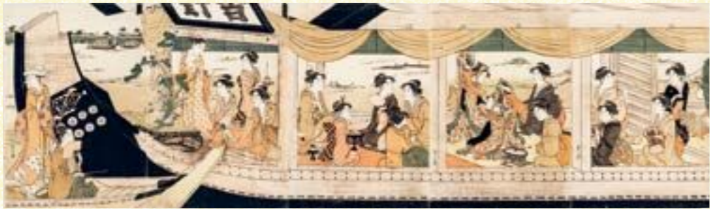
鳥文斎栄之《吉野丸船遊び》 大判錦絵5枚続 天明7-8年(1787-88)頃 千葉市美術館蔵

のちにスター絵師となる喜多川歌麿も、葛飾北斎も、デビュー時は細判の役者絵という画面が小さく、販売に適した期間も短い、安価な錦絵制作からスタートしています。一方で栄之は、デビュー間もなく大判の、しかも見応えのある続絵を多く手がけています。なかでも隅田川の豪華な船遊びの続絵は、栄之という浮世絵師のシンボルとも言える代表作です。