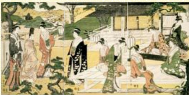
鳥文斎栄之《風流やつし源氏 松風》 大判錦絵3枚続 寛政4年(1792)頃 大英博物館蔵 The British Museum, 1907,0531,0,436,1-3

『源氏物語』など、古典主題を江戸の風俗に置き換えて描く「やつし絵」が多く知られるのは、栄之の錦絵の特徴の一つです。多くが武家や公家の上流階級の姿に描かれ、品の良い画風に加えて、しばしば用いられた「紅嫌い」(赤い色をわざと避けた錦絵で、紫を多用するところから紫絵とも言う。)の手法が、古典主題を一層雅やかに見せています。