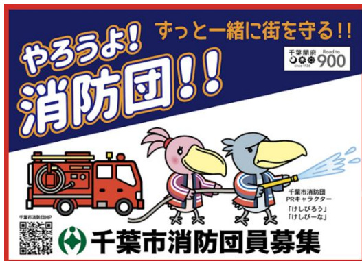
ステッカー・マグネットのデザイン