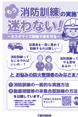
令和6年春の火災予防運動リーフレット