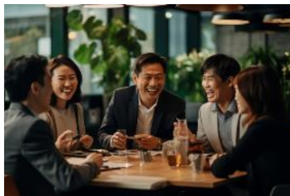
異業種交流会（イメージ図）