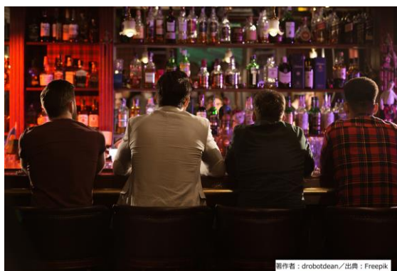
バー巡り（イメージ図）