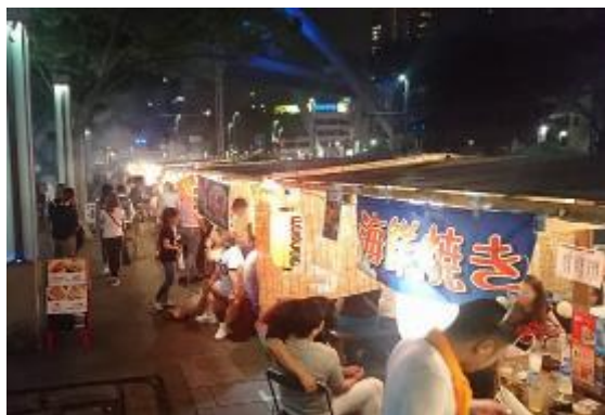
ちば富士見屋台横丁（令和元年度）