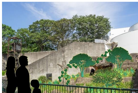
植樹後展示場（イメージ）