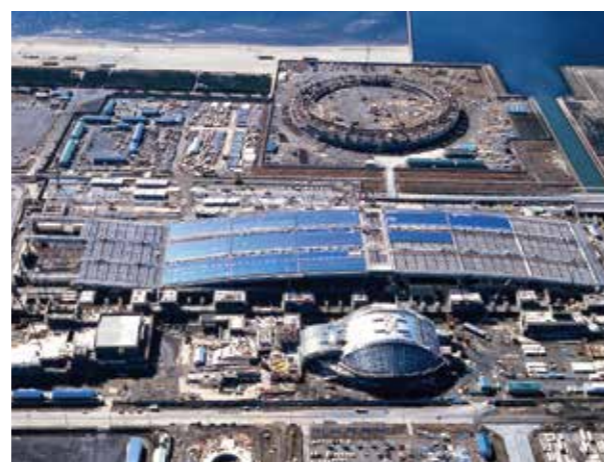
写真6. 建設中の幕張メッセとマリスタジアム