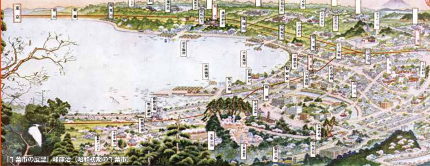
「千葉市の展望」 峰庫治（昭和初期の千葉市）