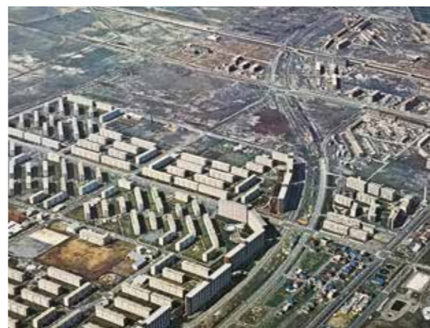
写真4. 整備が進む海浜ニュータウン(稲毛海岸駅周辺)