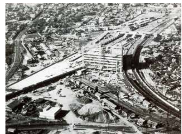
写真3. 移転工事中の千葉駅