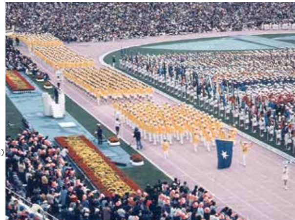
写真5. 若潮国体(現千葉県総合スポーツセンター)