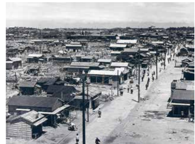
写真2. 終戦直後の栄町通り