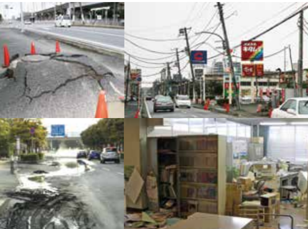
写真9. 市内でも大きな被害が出た東日本大震災(3.11)