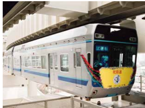
写真7. 千葉モノレール千葉駅～スポーツセンター駅開通