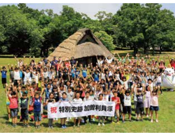
写真10. 加曽利貝塚が県内初、貝塚としても初の特別史跡に