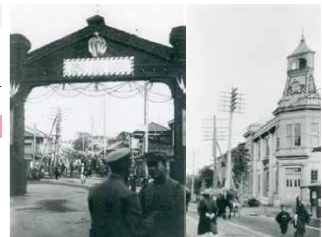
写真1. 市制施行を祝うアーチ門と当時の市庁舎