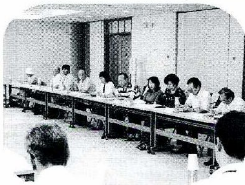
第1回区推進協の様子

近年、少子高齢化や核家族化の進展など社会情勢が大きく変化の中で、家族同士や地域で支え合う機能が弱まり、また、個人の価値観の多様化、ライフスタイルの変化、プライバシーへの配慮などが