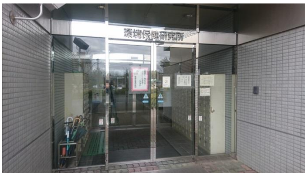
〈 環境保健研究所 正面玄関 〉