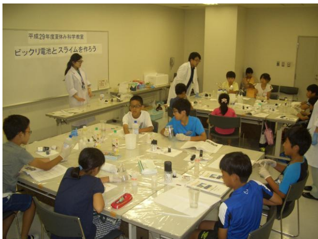
〈平成29年度 夏休み教室 開催の様子〉

他にも、学会などへの参加や発表を行うなど、調査研究を行った成果を内外へ広く発信しています。また、子どもたちに科学へ興味を持ってもらえるよう、夏には小学校5・6年生を対象に「 夏休み教室 」を開催しています。