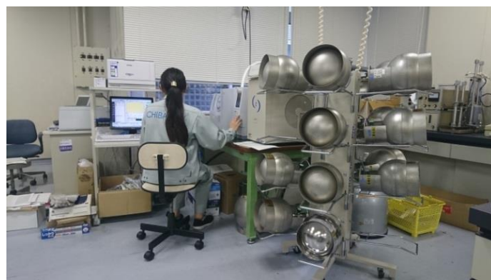
〈 有害大気汚染物質の検査の様子 〉