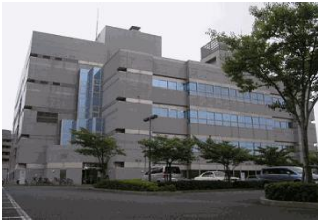
〈 千葉市総合保健医療センター 全景 〉

千葉みなと駅から徒歩5分の、「千葉市総合保健医療センター」内に環境保健研究所があります。