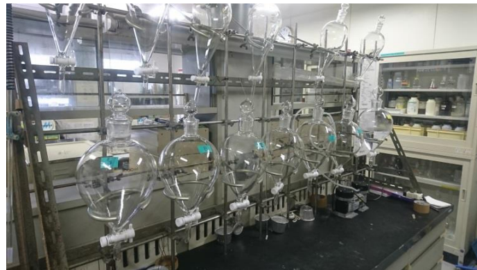
〈 分析室の中の様子 〉

なお、業務や施設について詳しく知りたいという方のために、見学を受け付けていますのでお問い合わせください。