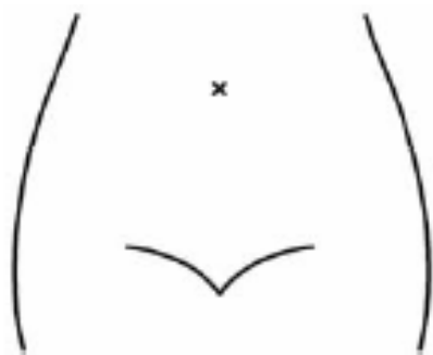
(ストマ及びびらんの部位等を図示)