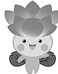
「花のあふれるまちづくり」 シンボルキャラクター ちはなちゃん

身体障害者福祉法第11条に基づく「身体障害者更生相談所」と知的障害者福祉法第12条に基づく「知的障害者更生相談所」の両機能を併せ持った施設です。 18歳以上の、身体障害者、知的障害者及びその家族からの専門的な知識や技術を必要とする相談に応じ、その福祉の向上を図ることを目的としています。