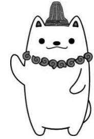
加曽利貝塚PR大使 かそりーぬ