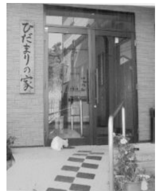
グループホーム（東寺山）