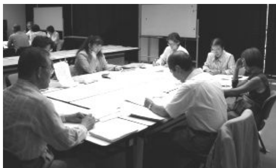
検見川・花園・朝日ヶ丘地区