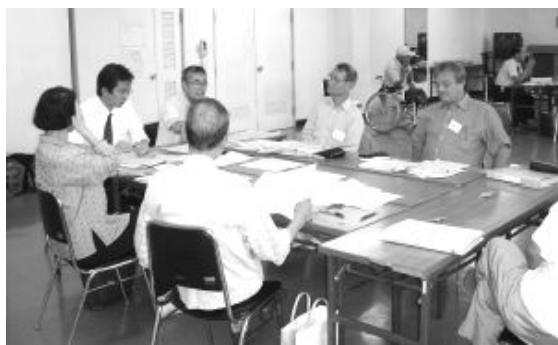
犢橋・206・こてはし台地区