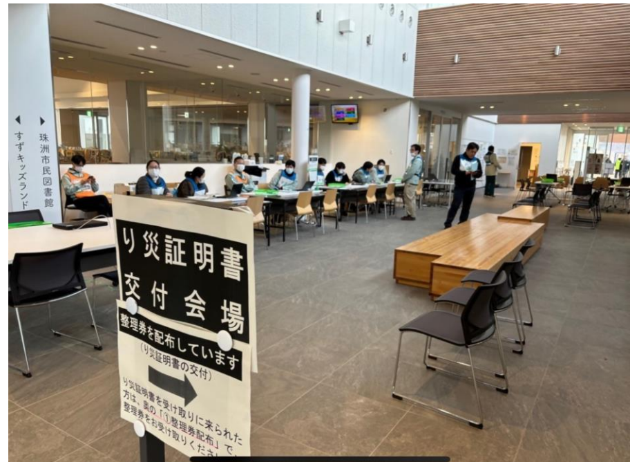
珠洲市民図書館にて