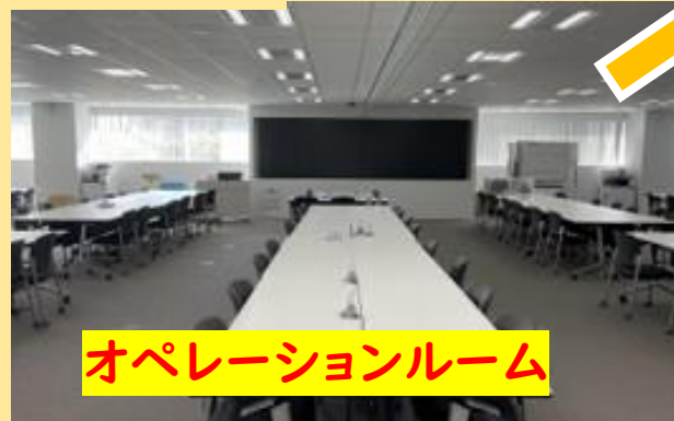
オペレーションルーム