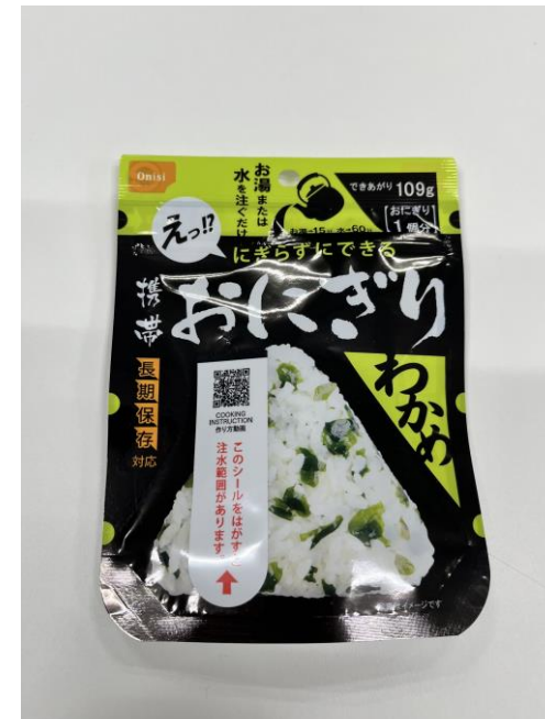
お湯を注ぐだけでおにぎりに