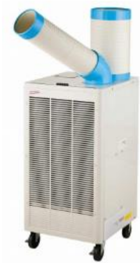
スポットクーラー