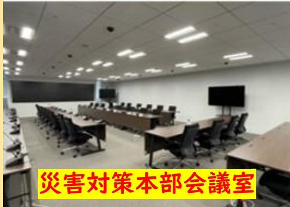
災害対策本部会議室

地震・風水害などの自然災害をはじめ、あらゆる危機事案に適切に対応し、市民の身体・生命・財産を守るため、危機管理センターを整備しました。