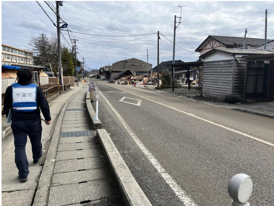
珠洲市 宝立町で撮影