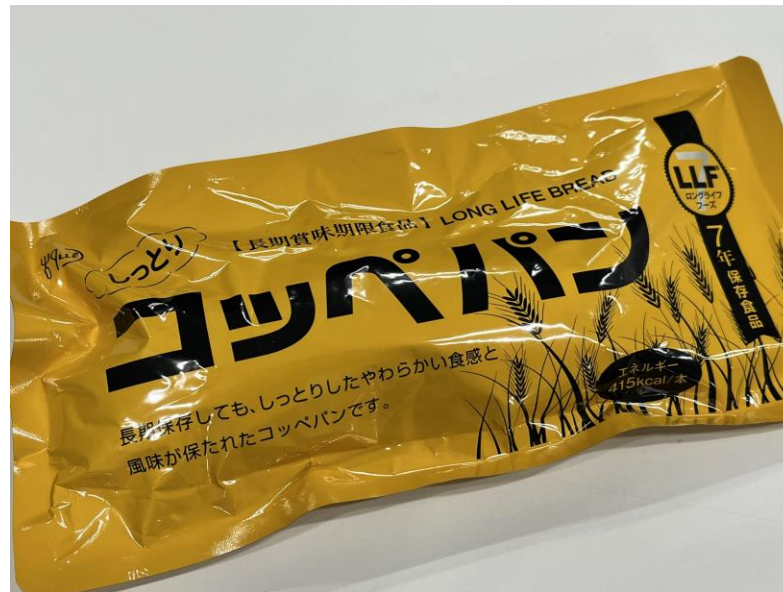
保存用コッペパン