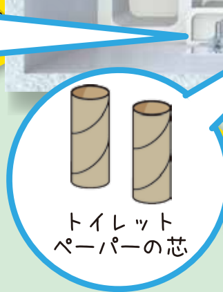
トイレット ペーパーの芯