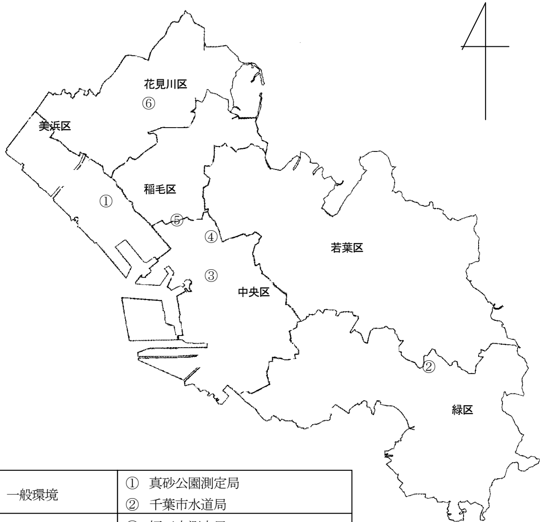
図1 有害大気汚染物質モニタリング調査地点