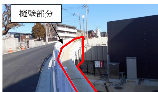
隣接道路から見た擁壁（②から撮影）