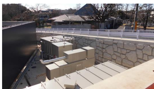
擬岩が造形された擁壁（①から撮影）