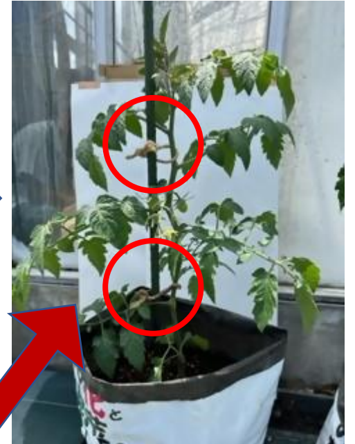
④わき芽をとった後