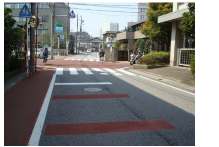
<対策内容> 車線のカラー化 <対策時期> 対策済み <対策後> [道路]