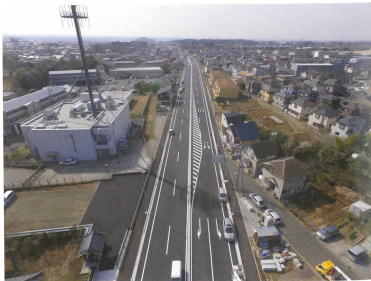
写真2: (主) 千葉大網線方向より