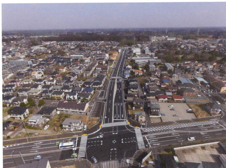
写真1: (都) 塩田町誉田町線方向より