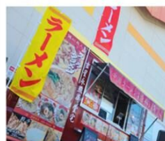
中国ラーメン 揚州商人