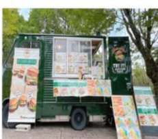
BELIEVER IN BURGER