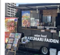
幕張ファイデーン