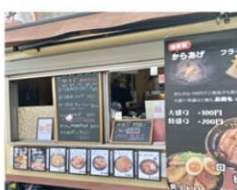
どんぶり専門店 丼ちゃん