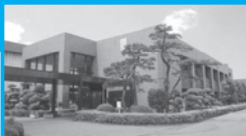
南部浄化センター

所在地:千葉市中央区村田町893 最寄駅:JR浜野駅西口(徒歩15分) 駐車場:敷地内にあり(平面駐車場)