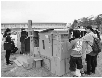
▲ダンボールハウス作り

帰りは少し雨が降っていたもの の、八幡宿駅まで子どもたちの帰り を見届け、無事終了しました。