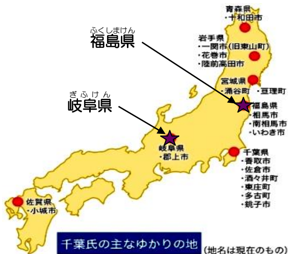
千葉氏の主なゆかりの地 (地名は現在のもの)

源頼朝を助けて、鎌倉幕府成立に貢献した千葉常胤の父親である常重が、1126年に現在の緑区大椎町から中央区亥鼻付近に本拠地を移し、都市としての千葉を築きました。そのため、今年が千葉開府890年という節目の年です。