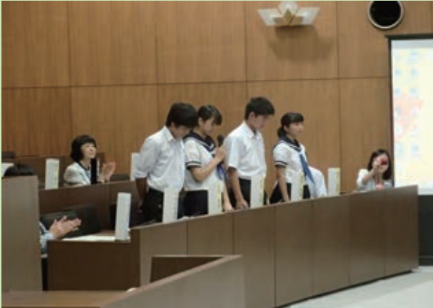
<ファシリテータによる議事運営>