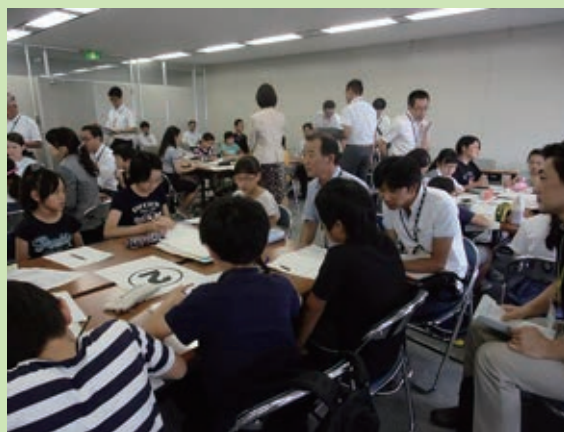
＜行政担当者との意見交換＞