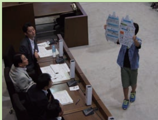
＜「千葉市の伝統や文化に親しむ取組」グループによるかそりーぬの形をしたパンフレットの提案＞