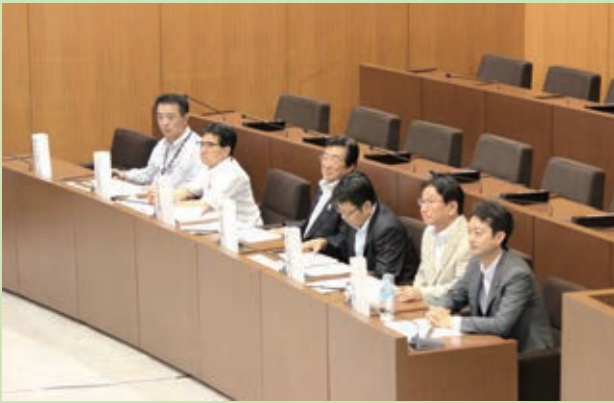
<各グループの提案を真剣に聞く答弁者のみなさん>