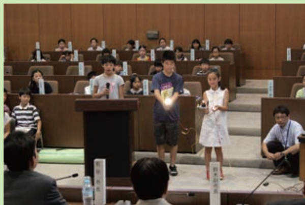
＜「災害や防犯に備えるためには」グループによるLEDの明るさを確認するための実演＞

子ども議会議員はグループごとに、自分たちの思いが伝わるように工夫しながら、提案や質問をしました。