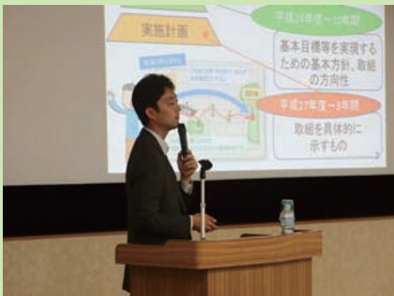
＜熊谷市長による講話

5回の学習会を実施し、市長や市政を担当する職員から千葉市の現状や取組、課題についての話を聞くとともに、自分たちで実施したアンケート調査や現地調査などの結果をもとに、提案や質問内容をまとめました。