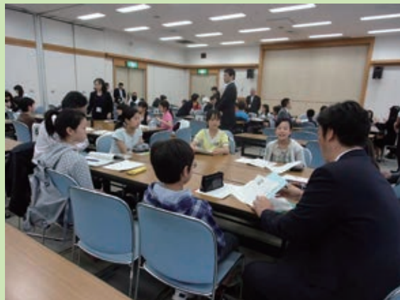
＜テーマごとにグループで協議＞