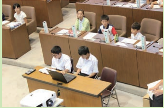
<グループの提案を支援するファシリテータ>