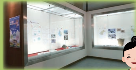
令和3年度の展示の様子

8月14日(日)には、「夏の縄文体験デー」を開催します。企画展のことや、むかしのことで知りたいことがあったら、学芸員に質問することができますよ。何でも聞いて下さいね。