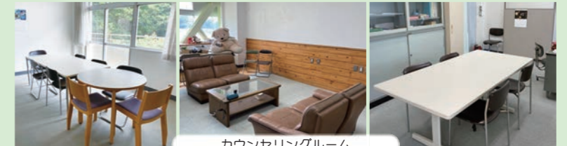
カウンセリングルーム