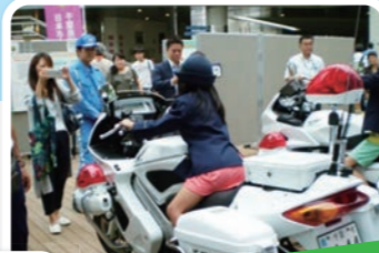
白バイに乗ってみよう！

「青少年の日」である9月の第3土曜日に開催！ いろいろな体験ができるよ！ぜひ遊びに来てね！