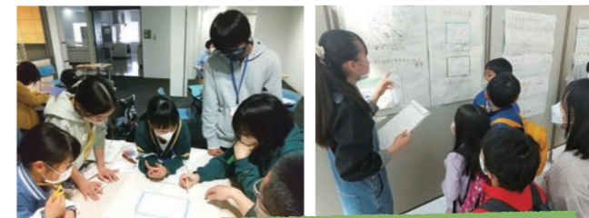
子ども議会で提案のあったごみ問題啓発イベントを行いました

子どもを取り巻く課題などについて、子どもたち目線による行政への提言やその実現に向けて活動します。