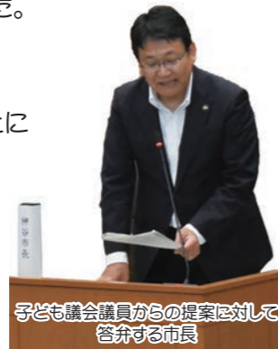
子ども議会議員からの提案に対して答弁する市長