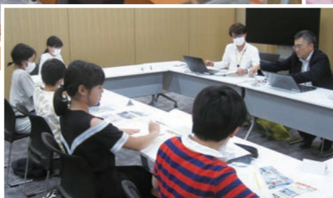
市政担当者との話し合い(第2回学習会の様子)