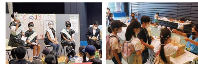
こども市長選挙の立会演説会

開催前の企画段階から、子どもが主体的に関与し、子どもたちだけで市役所をはじめ、お店や会社などの「まち」を運営します。