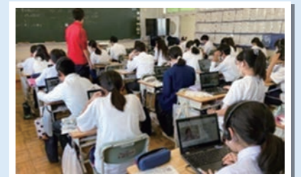
オンライン英会話の様子

生徒が自らの能力に合う教材を選び、授業の他にも、希望時間帯に家庭からオンラインで学習しています。マンツーマン指導により「話す力」を身に付けようと、各自課題を見つけながら主体的に取り組んでいます。