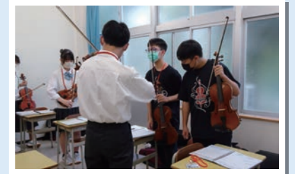
両校で台湾と日本の曲を一緒に演奏