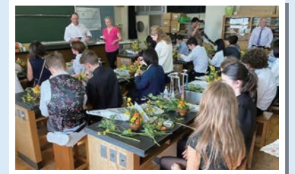
交流校と華道教室