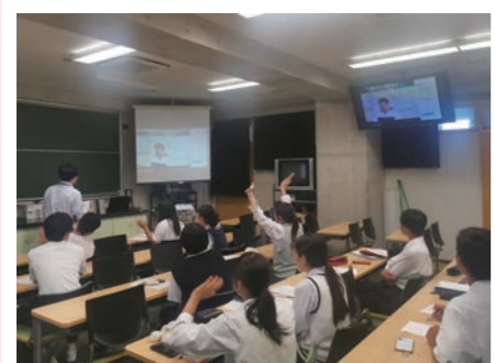
リモートによる顔合わせ (グループ決めの様子)