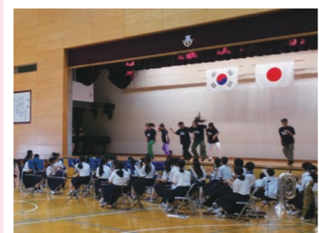
生徒の来日を歓迎する セレモニーを開催