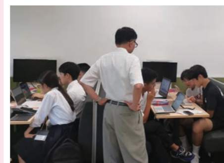
CO 2 削減について日韓合同で 発表するための準備中