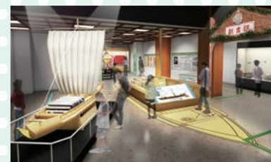
郷土博物館展示リニューアルイメージ図

千葉開府900年に向けて、千葉氏をはじめとする郷土の歴史を学ぶことができる拠点とするため、展示をリニューアルします。