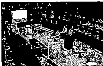
7/26 子ども議会当日のグループによる提案