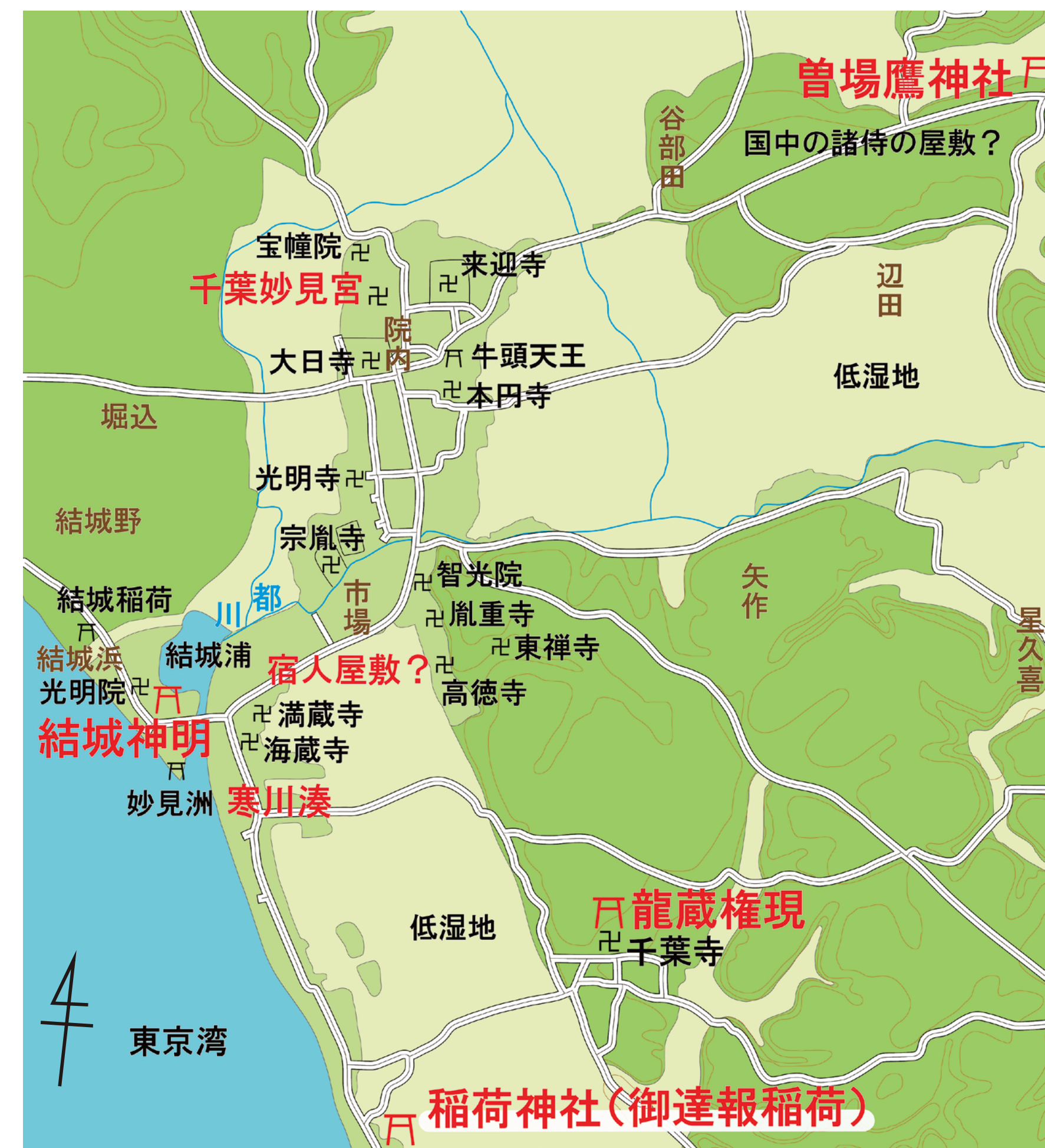
15世紀中頃の千葉の町

千葉妙見宮(現在の千葉神社)に伝わる記録『千学集抜粋』に、若葉区貝塚町にあった曾場鷹神社から御達報稲荷までの間が千葉の町であったこと、御達報稲荷は町の南端を守る神であり、このほか曾場鷹神社や結城神明(現在の神明神社)、千葉寺龍蔵権現などの神々によって、千葉の町が守られていたことが記されています。