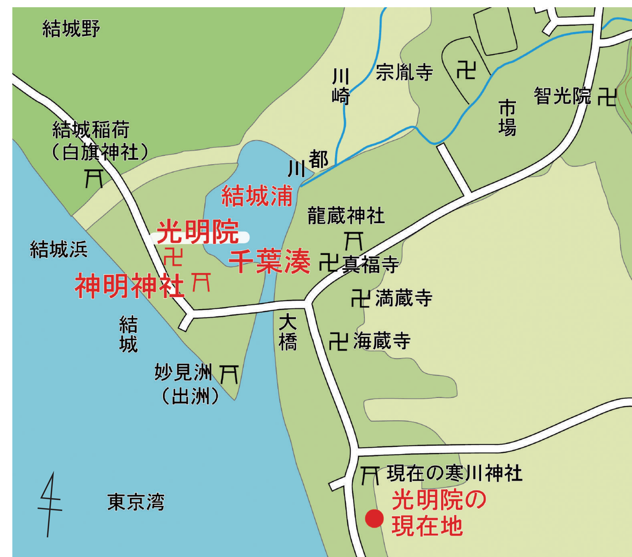
15世紀中頃の千葉湊周辺図

年貢が千葉湊から鎌倉方面に船で運ばれたことが記されています。光明院には年貢の運搬を取り仕切るため派遣された僧が滞在していました。