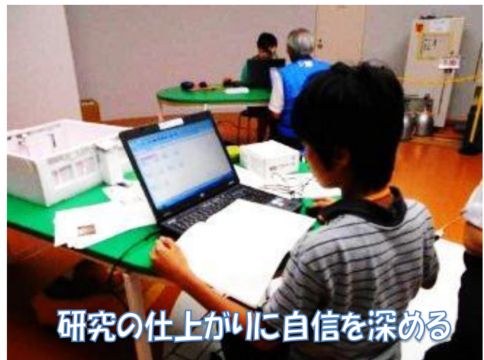
研究の仕上がりに自信を深める