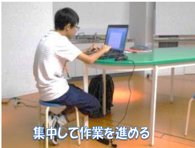
集中して作業を進める