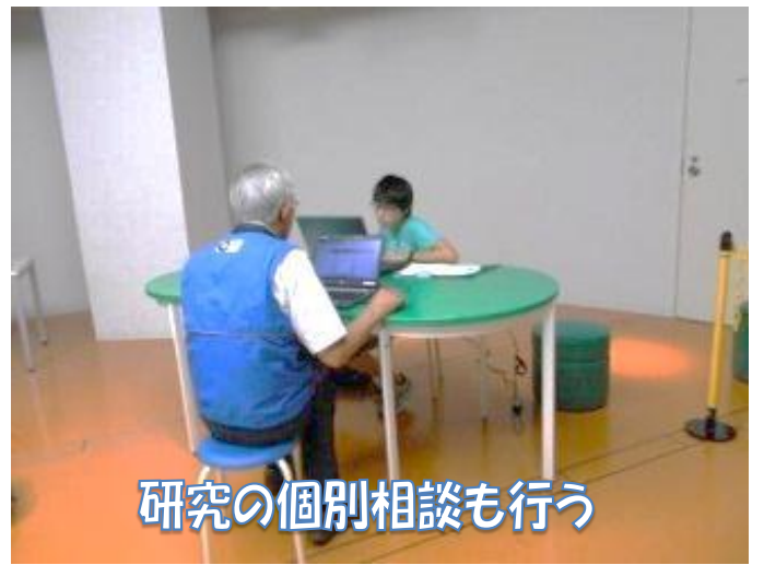
研究の個別相談も行う