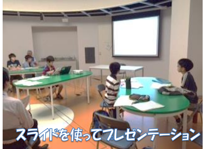
スライドを使ってプレゼンテーション