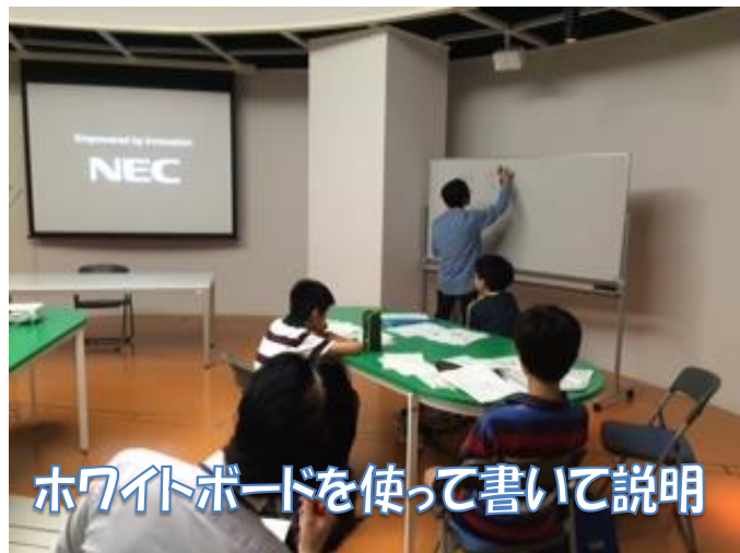
ホワイトボードを使って書いて説明