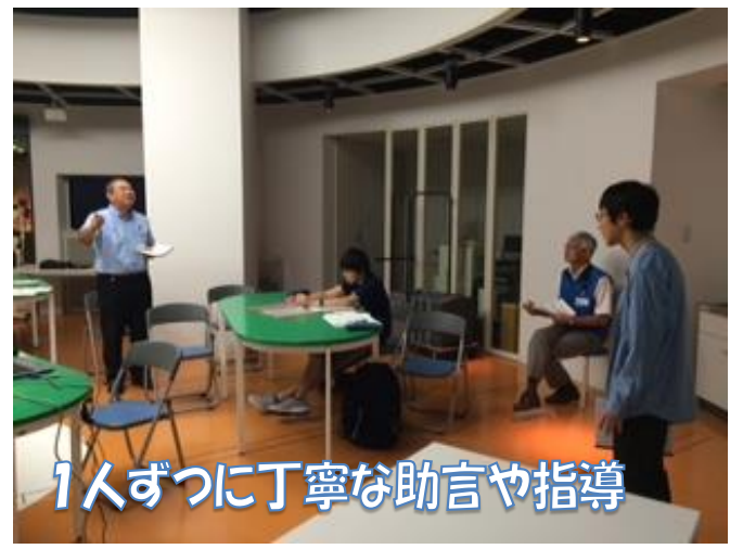
1人ずつに丁寧な助言や指導