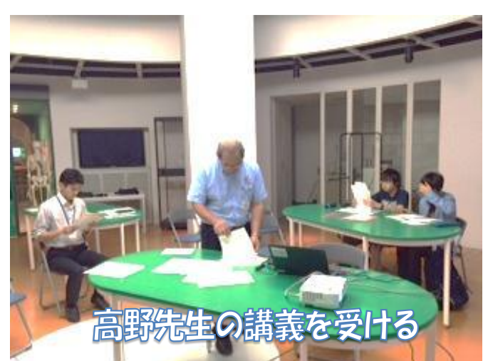
高野先生の講義を受ける