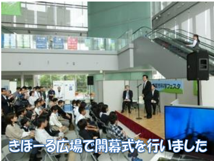
きぼーる広場で開幕式を行いました

日時：平成27年10月10日（土）・11日（日）10：00～16：00 場所：きぼーる（千葉市科学館他） 内容：サイエンスカフェ/研究者への道（若手研究者の生活と考え）—中高生との懇談会— 他