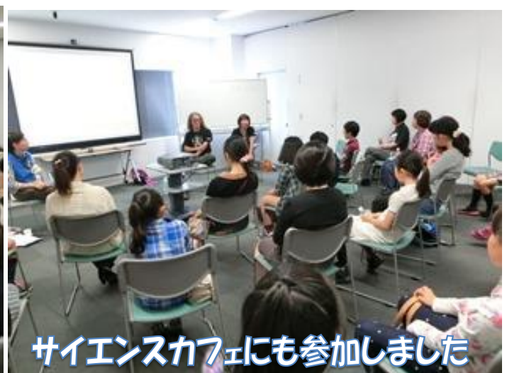
サイエンスカフェにも参加しました