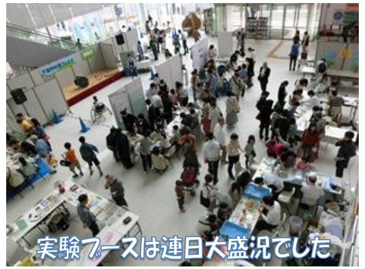
実験ブースは連日大盛況でした