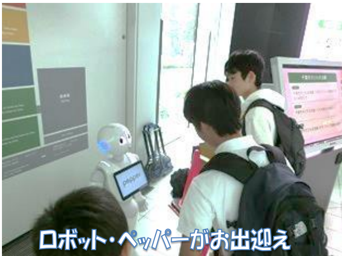
ロボット・ペッパーがお出迎え