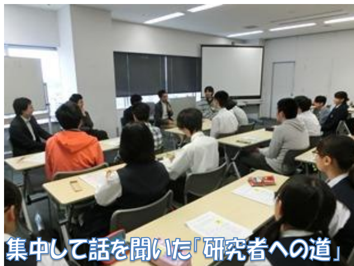
集中して話を聞いた「研究者への道」